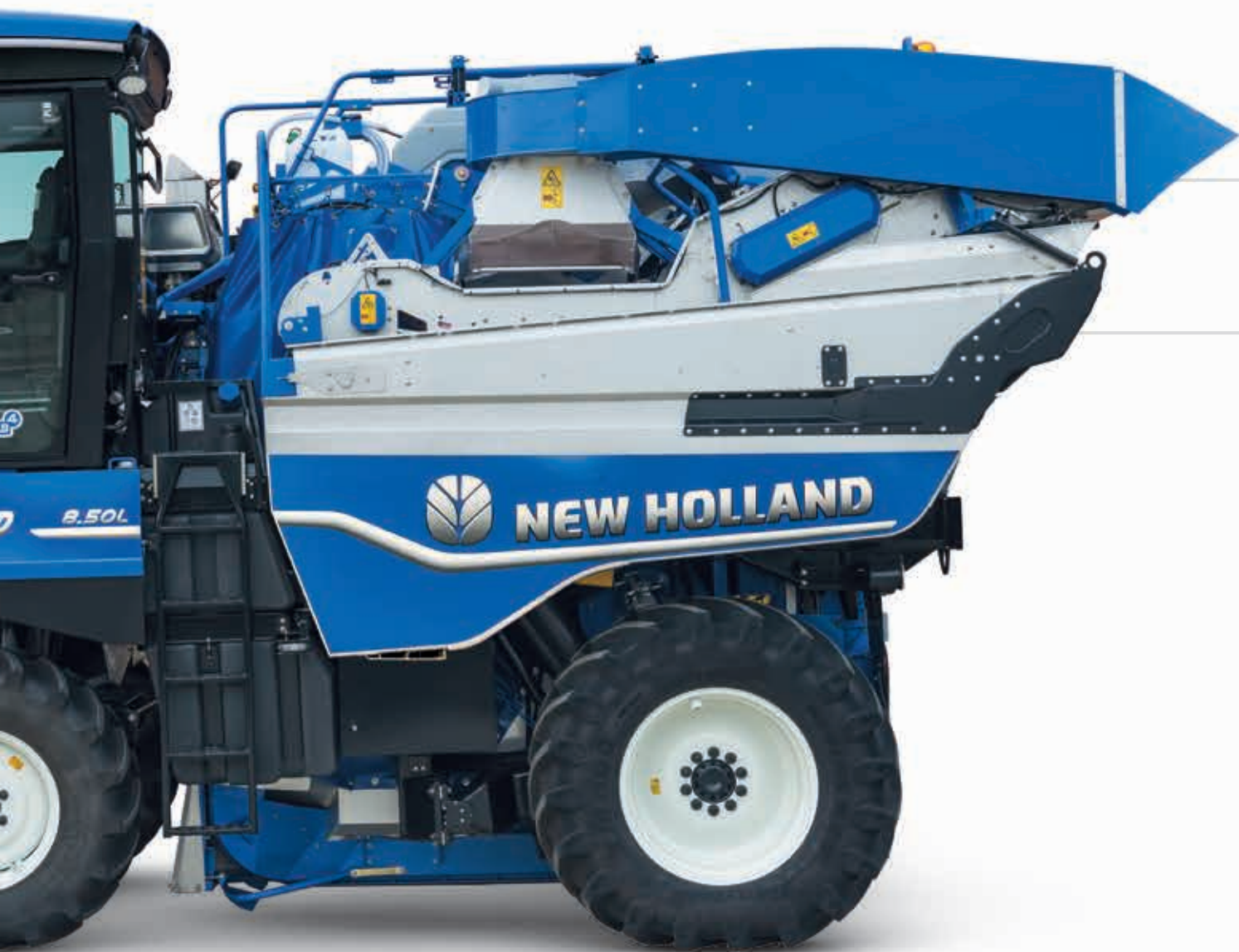
Potenza e precisione Vedi pagina 14